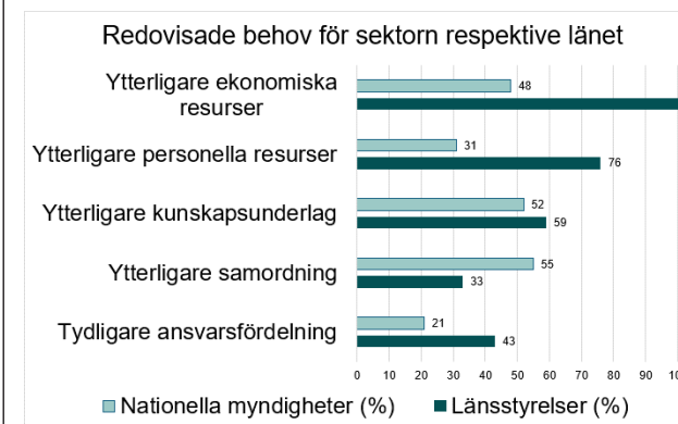
Figur. Redovisade behov för sektorn eller länet, per nationella myndigheter respektive länsstyrelser. Behov med lägst antal redovisningar har exkluderats i figuren.

Samtidigt finns tydliga behov som påverkar hur långt arbetet når. Myndigheterna har fått svara på vilka behov de ser i klimatanpassningsarbetet för sin sektor eller länet. Resultatet visas i figuren nedan.